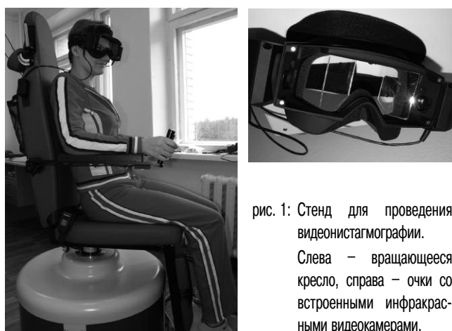
рис. 1: Стенд для проведения видеонистагмографии. Слева – вращающееся кресло, справа – очки со встроенными инфракрасными видеокамерами.

Видеонистагмография (ВНГ) – более совершенный метод регистрации нистагма, отличающийся высокой точностью, экономией времени, отсутствием артефактов при регистрации. Прибор представляет собой нистагмограф на базе персонального компьютера, использующий для записи и анализа данных метод видеосчитывания. Пациент надевает на голову маску, в которую встроены две специальные легкие инфракрасные видеокамеры, позволяющие одновременно исследовать движения обоих глаз. Такая комбинированная маска предоставляет возможность наблюдать за перемещениями глаз, а программное обеспечение регистрирует координаты и скорости этих перемещений (рис. 1). Эта маска очень удобна, легко изменяет форму с учетом межзрачкового расстояния и необходимого фокального расстояния. Преимущества этого метода, который в последние годы используют все ведущие клиники мира, очевидны: точнейшая фиксация горизонтальных, вертикальных и вращательных движений глаз, компьютерная обработка данных в режиме реального времени, нет необходимости в экранированном помещении (т.к. отсутствуют электроды и артефакты), большая экономия времени для исследования, абсолютно точный расчет изучаемых параметров. Для регистрации и анализа данных в распоряжении имеются различные модули программного обеспечения: