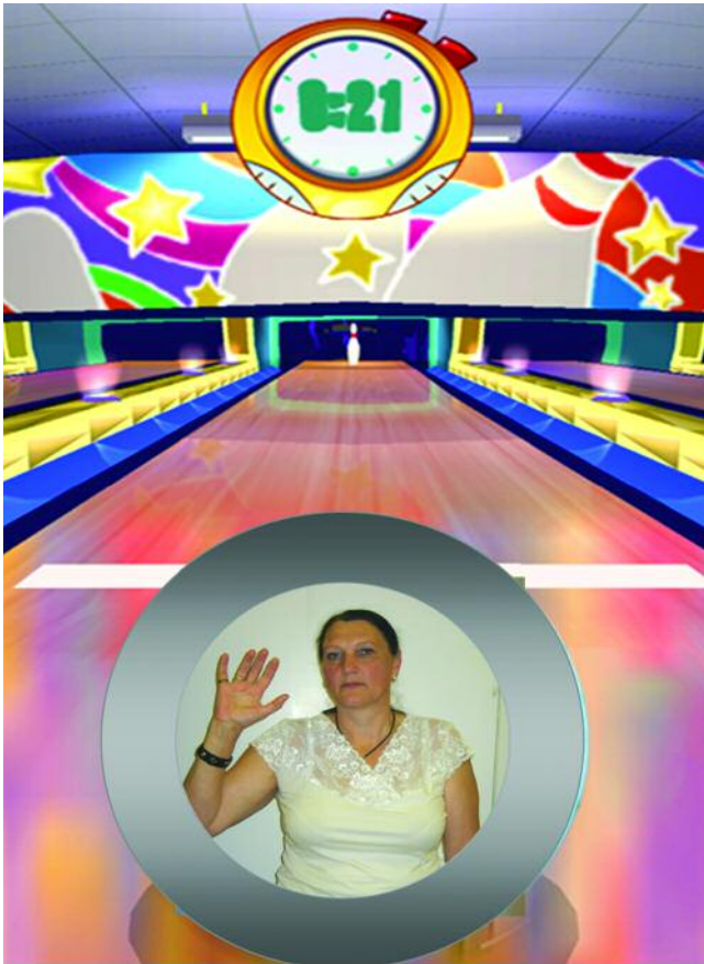
рис. 1: Испытуемый, выполняющий задание согласно виртуальной игре «боулинг» из серии EyeToy Play 3, разработанной корпорацией Sony

технологий являются виртуальные игры серии EyeToy, созданные корпорацией Sony. В середине 1990-х годов Sony предложила видеоигры, использующие недорогие веб-камеры с игровой приставкой PlayStation II. Веб-камера регистрирует изображение, стоящего перед ней человека и затем помещает его в игровой сюжет, происходящий на экране (рис 1). Таким образом, человек становится участником игры, в процессе которой он должен ловить различные предметы, имитировать движения борьбы кунг-фу, боулинга, бокса или баскетбола. Наши недавние исследования показали, что использование игр серии EyeToy Play 3 в течение 40 минут на протяжении 2 недель позволило улучшить координацию, точность и скорость движения у ряда пациентов с болезнью Паркинсона и различными формами спиноцереbellарных атаксий.