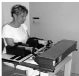
рис. 3: Первый робот, в котором возможна тренировка дистальных отделов рук Bi-Manu-Track

больных, имеющих произвольную активность в паретичной руке. При использовании последней методики больные совершали движения с сопротивлением, сила которого определялась их способностями. Оказалось, что в группе, использующей прогрессивную терапию с сопротивлением, отмечалось увеличение силы не только в проксимальных, но и в дистальных отделах руки.