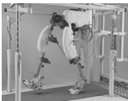
рис. 5: Роботизированная система Lokomat

работе М. Ng et al. [32], в которой участвовали 56 больных в подострой стадии инсульта, было показано, что применение механического тренажера для ходьбы, особенно в сочетании с нервной-мышечной стимуляцией, оказывается значительно более эффективным для восстановления способности ходьбы, чем традиционная терапия. При этом эффект сохраняется и через 6 месяцев наблюдения. В другом рандомизированном контролируемом исследовании [34], в котором были проанализированы результаты применения GT-1 в четырех немецких реабилитационных центрах, показано, что использование интенсивной тренировки ходьбы с помощью GT-1 в сочетании с классической физиотерапией значительно эффективнее, чем применение только традиционного лечения.