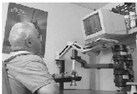
рис. 1: Первый робот для тренировки руки MIT-MANUS

В другом исследовании [14] изучалась эффективность этого робота для тренировки паретичной руки у 20 больных с давностью инсульта от 1 до 5 лет. Терапия с использованием робота проводилась три раза в неделю в течение 6 недель. Были предложены две методики тренировки: сенсомоторная (для больных с пlegией в руке) и так называемая прогрессивная терапия с сопротивлением – для