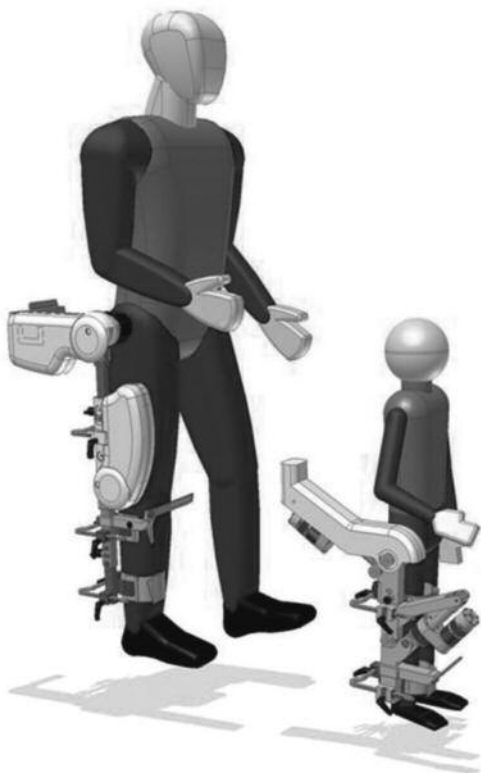
рис. 6: Lokomat – ортезы для взрослых и детей

Помимо системы Lokomat для взрослых пациентов фирмой Носота разработана первая в мире система Pediatric Lokomat, которая может использоваться для интенсивной тренировки ходьбы у детей с 4-х лет при различных неврологических заболеваниях, сопровождающихся нарушением походки. Важно отметить, что система Lokomat для взрослых после некоторой модернизации может также использоваться с детскими ортезами нижних конечностей (рис. 6).